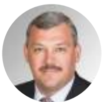
Сергей Гапликов Глава Республики Коми

«Новые меры поддержки позволят семьям с детьми быть уверенными в своём будущем.»