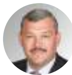
Сергей Гапликов Глава Республики Коми

Мы первыми в России начали выплачивать региональный семейный капитал при рождении первенца. Это 150 тысяч рублей из республиканского бюджета, которые станут хорошей поддержкой для молодых семей.